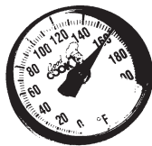
Termómetro dial Área sensible de 2"

3 minutos más antes de comer la carne de res, ternera, cerdo y cordero